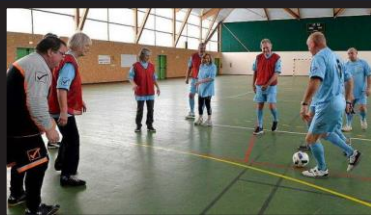
Foot en marchant